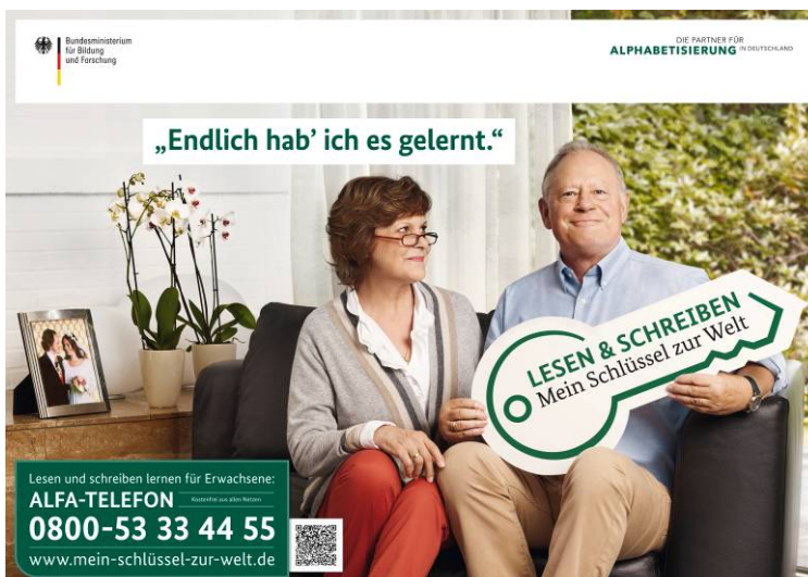
Kampagne „Lesen & Schreiben – Mein Schlüssel zur Welt“ Plakatmotiv „Wohnzimmer“.