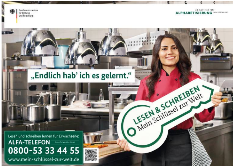
Kampagne „Lesen & Schreiben – Mein Schlüssel zur Welt“ Plakatmotiv „Köchin“.