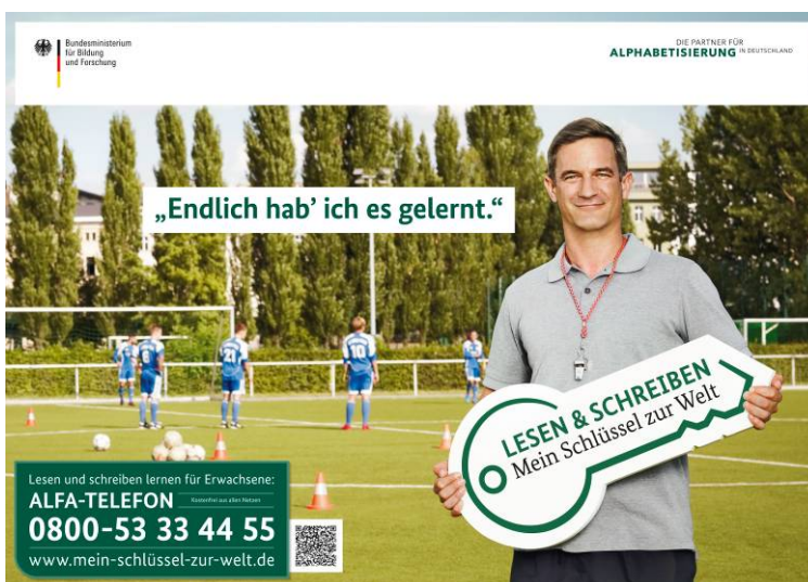
Kampagne „Lesen & Schreiben – Mein Schlüssel zur Welt“ Plakatmotiv „Fußball“.