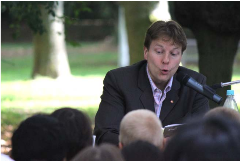
Tim-Thilo Fellmer, ehemaliger Lerner, Buchautor, Botschafter für Alphabetisierung.